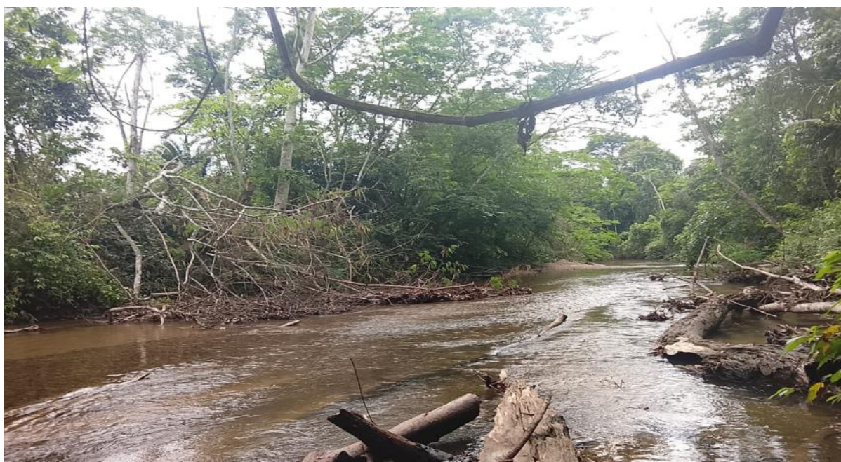
FIGURA N°03: EN LA TEMPORADA DE MAXIMAS AVENIDAS, EL RIO CHIO EROSIONA EN LA MARGEN IZQUIERDA DEL CERCADO A LA POBLACION DEL CASERIO SAN JOSE. QUE REQUIERE DE LIMPIEZA Y DESCOLMATACION DE CAUCE