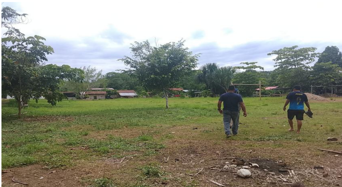
FIGURA N° 02: RIO CHIO EXPUESTO ANTE UN DESBORDAMIENTO EN EL CERCADO A LA POBLACION, CASERIO SAN JOSE