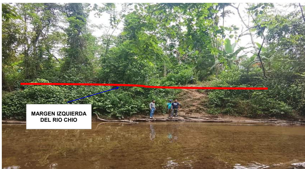
FIGURA N° 01: TRAMO CRÍTICO EN EL RIO CHIO, SECTOR CASERIO SAN JOSE, DISTRITO DE IRAZOLA, PROVINCIA DE PADRE ABAD, DEPARTAMENTO DE UCAYALI.